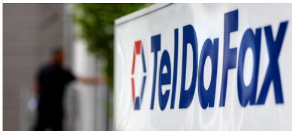
Teldafax ist seit 2011 pleite und stellt Forderungen an seine ehemaligen Kunden. Unser Redakteur klagte.

Unser Redakteur hatte Streit mit Teldafax, dem insolventen Energieunternehmen – und gewann vor Gericht. Das Urteil hat Gewicht vor allem für die mehr als 300.000 ehemaligen Teldafax-Kunden, die der Insolvenzverwalter ebenfalls belangen will. Von Timot Szent-Ivanyi